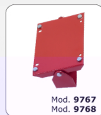
Mod. 9767 Mod. 9768