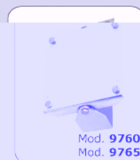
Mod. 9760 Mod. 9765