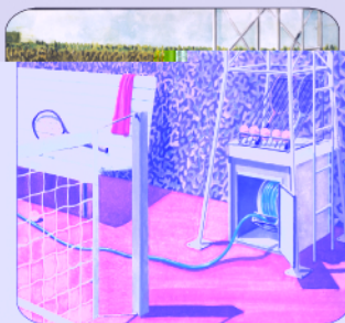
Mod. 9760 Staffa Girevole per 9523 Swivel Bracket for 9523

Spring driven hose-reels made of AISI 304 stainless steel Heavy duty series , designed for applications requiring lenght hoses max. 20 mt (1/2" hose). Reels are standard supplied without hose and it's compatible with oil, antifreeze, grease, air and water at low and high pressure. For the hose selection see the table at end of page.